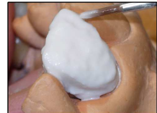
fig. 2 LA STRATIFICAZIONE