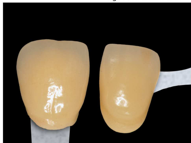
fig. 4 L'ELEMENTO FINITO