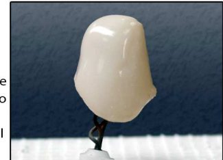
fig. 1 IL LINER COTTO

TRESSIS ITALIA SRL Viale Italia, 194 31015 CONEGLIANO (TV) TEL (+39) 0438-418316 FAX (+39) 0438-426450 SERVICE-ON-LINE 3479442860 www.tressis.it info@tressis.it